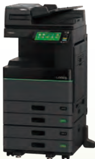
ペーパーリユース システム「Loops」