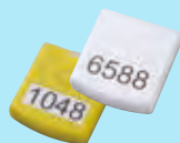
センシング・ソリューション (ビーコン端末)