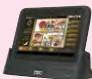
タブレット型 セルフオーダーシステム