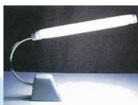
1955年 ホームスタンド7型「FO-1013」

東芝本社から独立し、「自主自立」の理念のもとで次々と新たな分野を開拓。事務機、照明、家電という事業の三本柱を確立し、その後の目覚ましい発展へとつなげる基礎を築き上げる。1960年代後半にはマーケットを世界に求め、北米、欧州、東南アジア市場へと進出する。