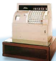
1957年 初期の機械式レジスター