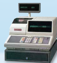
1979年 スキャニング POSシステム「M-800」