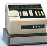
1971年 電子レジスター マコニック 「BRC-30B」

事務機部門では、いち早く電子レジスターを開発。事務機の世界が電子化へとシフトする中にあって、他社を大きくリードする。1980年代には、プリンタ、POSをはじめとする新たな分野に挑戦。プリンターOEM事業では、わずか3年で世界のトップグループへ。POS事業では、世界初の無線POSの開発に成功する。