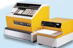
1973年 世界初マイコンチップ搭載 電子会計機「BRC-32CF-GS」