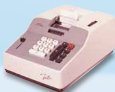
1964年 小型電動加算機 トステック「BC-401」