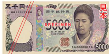
津田梅子(つだ・うめこ)