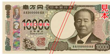
渋沢栄一(しぶさわ・えいいち)