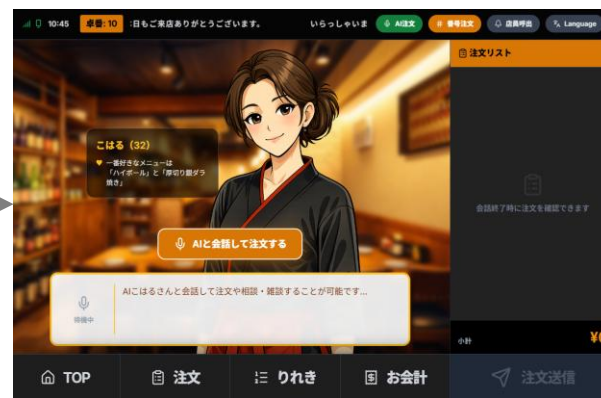
会話して注文するボタン押下で会話開始