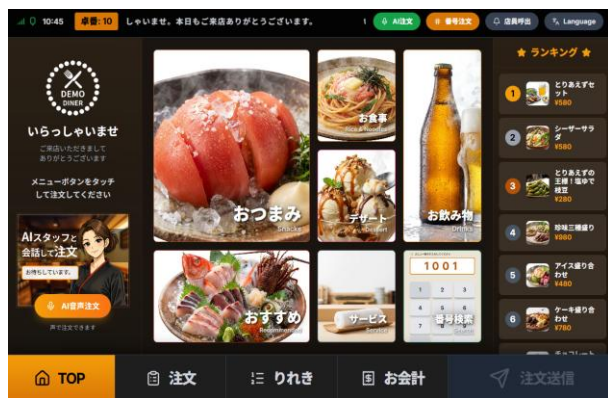
トップバナーおよびヘッダから移動