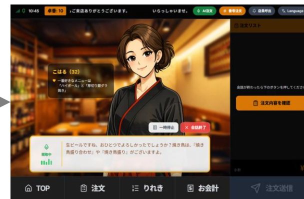
会話の流れで必要情報がそろると注文確認