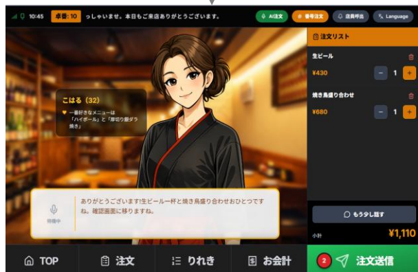
ユーザーからの「それでいいよ」等の指示で注文リストを自動生成