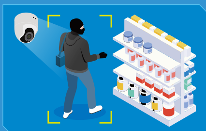
AIが来店人物を自動検知