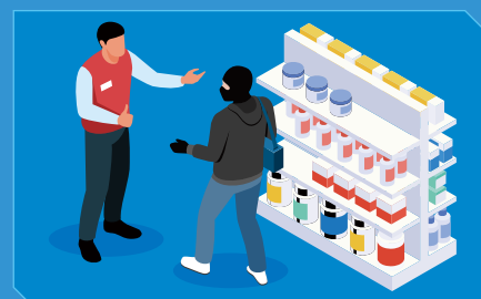
リアルタイムで現場対応