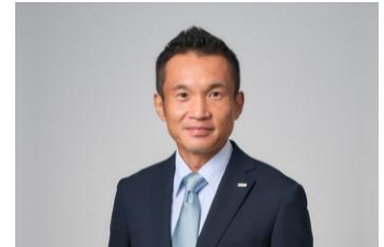
NTTドコモビジネス株式会社 エバンジェリスト

2006年、NTTコミュニケーションズ株式会社(現NTTドコモビジネス株式会社)入社。一貫してセキュリティ領域に携わり多くのお客さまの課題解決を支援しながら、2023年にお客さまの事業継続性を強化する「Cyber Resilience Transformation(CRXソリューション)」を立ち上げ、同社のビジネスを拡大してきた。現在は同社のエバンジェリストの一人として、サイバーセキュリティに関する情報の発信や提言を行いながら、社会・産業の発展やお客さまの課題解決に貢献する活動を担っている。