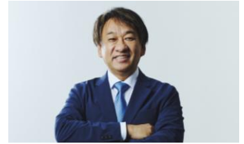
日本マイクロソフト 業務執行役員 エバンジェリスト

マイクロソフトの業務執行役員であり、多くの最新テクノロジーを伝え広めるエバンジェリスト。「エバンジェリスト」とはわかりやすく製品やサービス、技術を紹介する職種。他にコミュニケーションやデモンストレーションといった分野での講演や執筆活動も行い、製造業、金融業、官公庁、教育機関などでのプレゼンテーション講座を幅広く手がける。著書に「エバンジェリストの仕事術」、「プレゼンは“目線”で決まる」などがある。