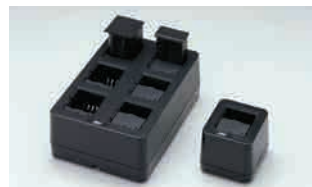
▲1.6スロットバッテリー充電器 ※別売の充電器にバッテリーは含まれません。