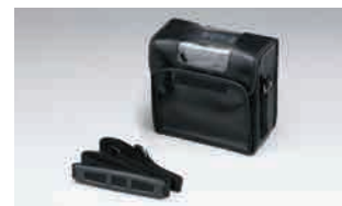
▲キャリーケース ▲ショルダーストラップ ※キャリーケースにはショルダーストラップが付属します。