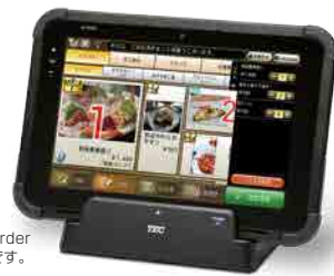
*画面はRelaxOrder 搭載時のものです。