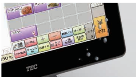
防滴性ディスプレイ

濡れものを扱う店舗でも安心の防滴性や、埃・油煙の入りにくいファンレス設計など、現場環境を知り尽くしたテックのノウハウが隔々に活かされています。また衝撃に強いSSD採用や停電時も安心のUPS装備。また、ディスクを常に二重化するRAIDモデルも用意しました。