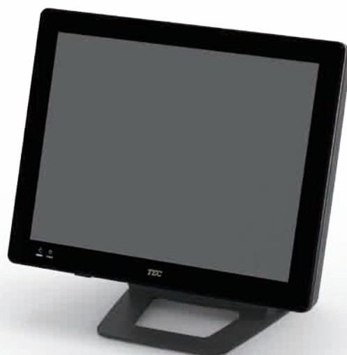
QT-20T 15型ジェットブラック