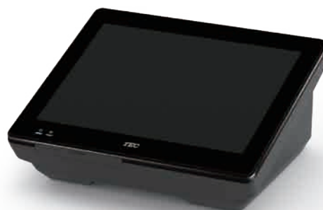
QT-20H 12.1型ジェットブラック