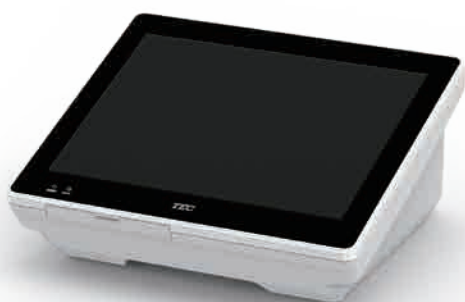
QT-20H 12.1型ピュアホワイト