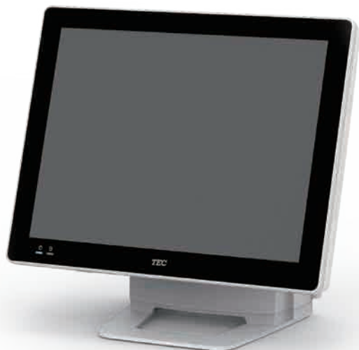
QT-20T 15型ピュアホワイト