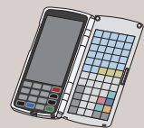
ハンディターミナル