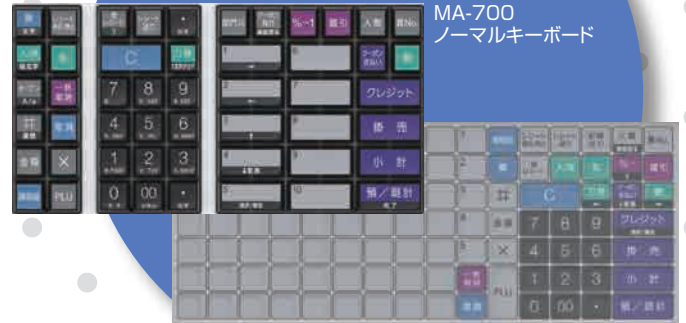
MA-700 ノーマルキーボード