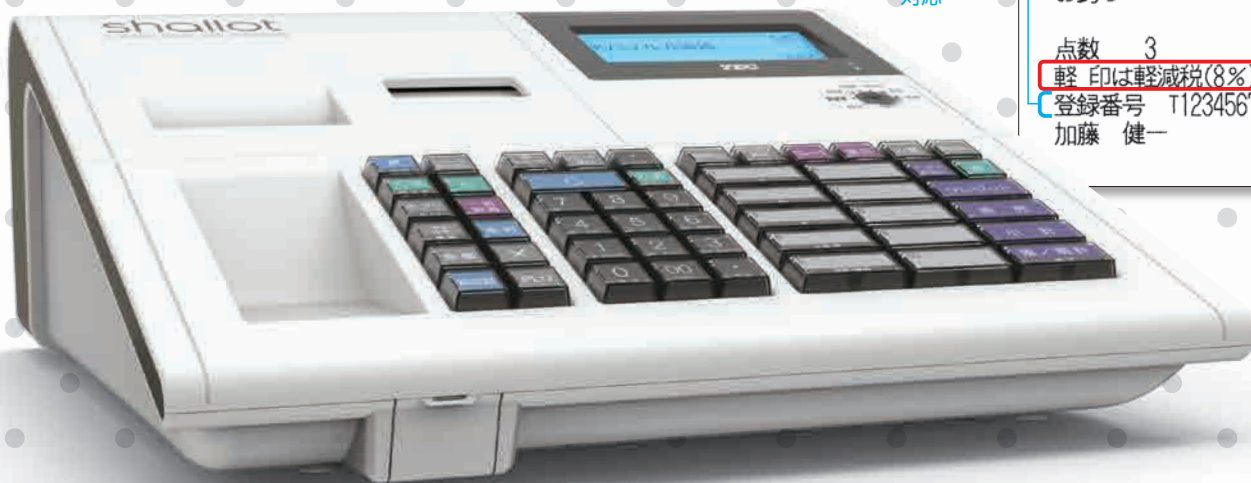
▲MA-700(ビュアホワイト)10部門タイプ