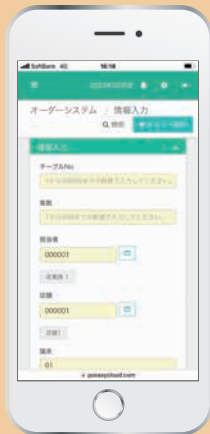
◀Webブラウザを 使用するため、 専用アプリは不要

店舗運営に欠かせないオーダーシステムから レジ業務までこなし、さらに販売分析まで 見ることができる、まさにお店の運用に くわしいスグレものです。