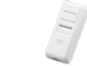
スキャナ オプトエレクトロニクス OPN-4000i 外形寸法/36.0(W)x83.0(D) x21.5(H)mm