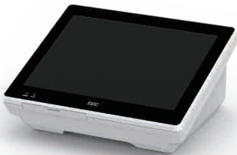
QT-20H 12.1型ピュアホワイト