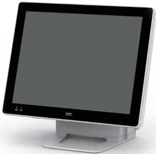
QT-20T 15型ピュアホワイト