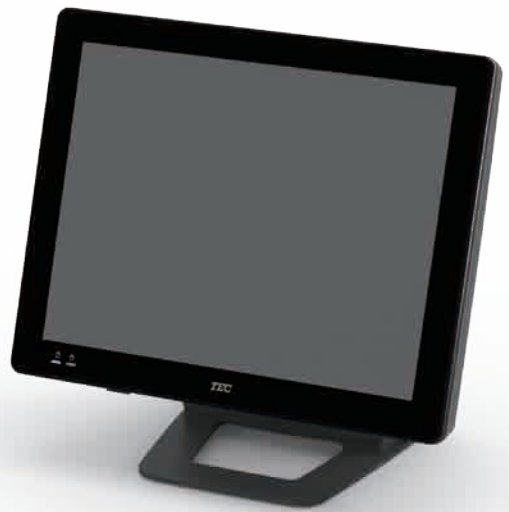
QT-20T 15型ジェットブラック