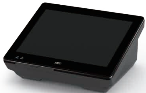
QT-20H 12.1型ジェットブラック