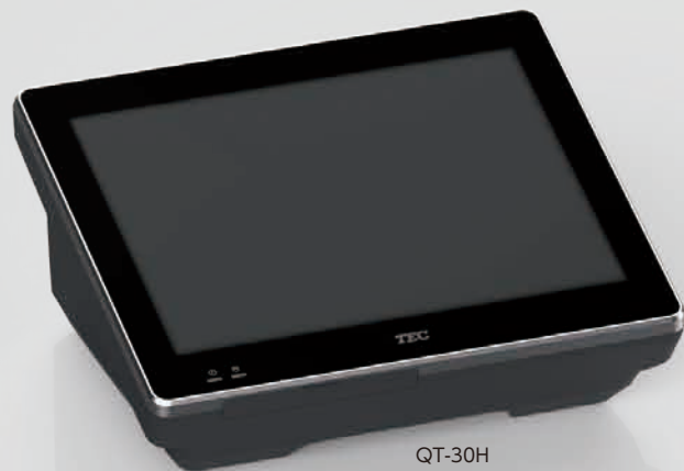
QT-30H 12.1型ジェットブラック