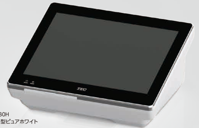
QT-30H 12.1型ピュアホワイト