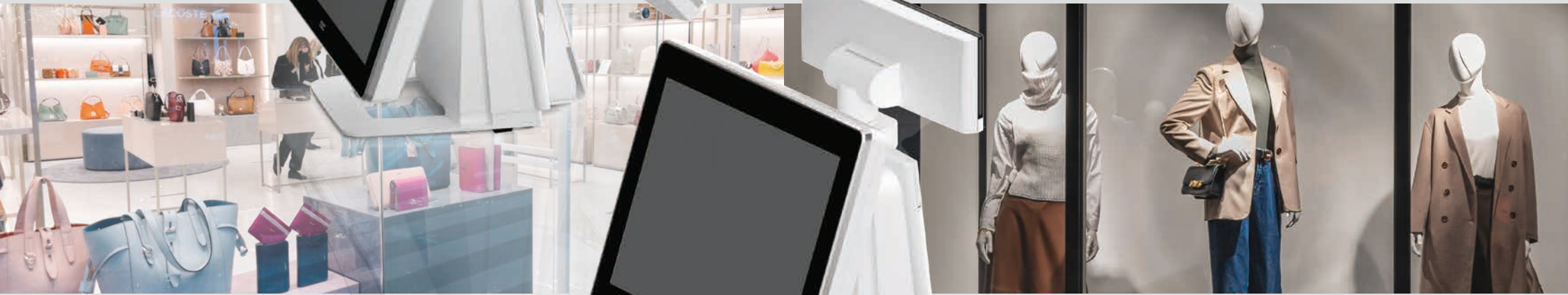
QT-30T 15型ピュアホワイト 本体一体型12.1型カラー-TFT (タッチパネル)客面表示器

決済手段の多様化、人手不足などの課題解決に向け、それぞれの現場に適した効率化が求められる今、さまざまな販促アプリなどへの対応も可能な多機能タッチターミナルの登場です。「QT-30シリーズ」は変化する店舗環境に応じて、フレキシブルな機器構成で対応。さらに、十分な堅牢性、コンパクト設計、高い信頼性により、変容する専門店の最前線POSターミナルとして活躍します。