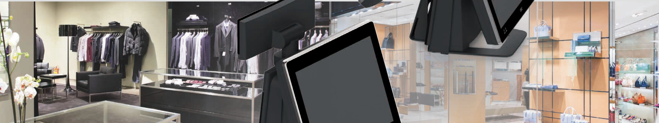
QT-30T 15型ジェットブラック 本体一体型12.1型カラーTFT (タッチパネル)客面表示器