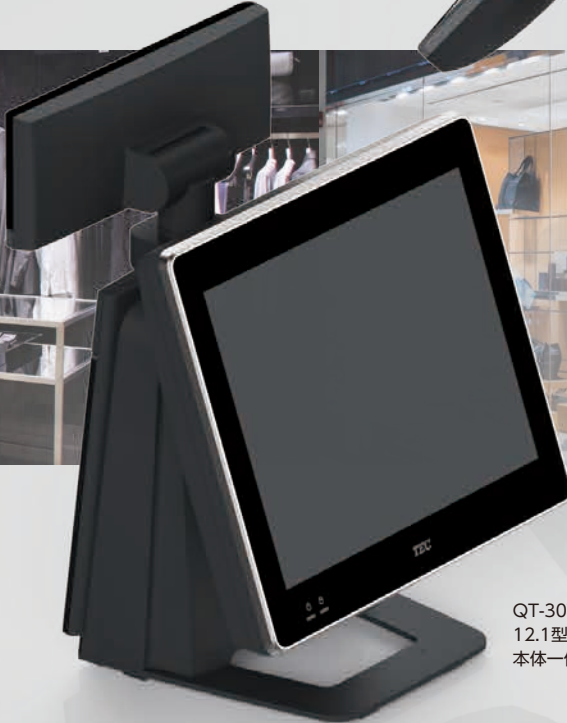
QT-30T 12.1型ジェットブラック 本体一体型LCD客面表示器